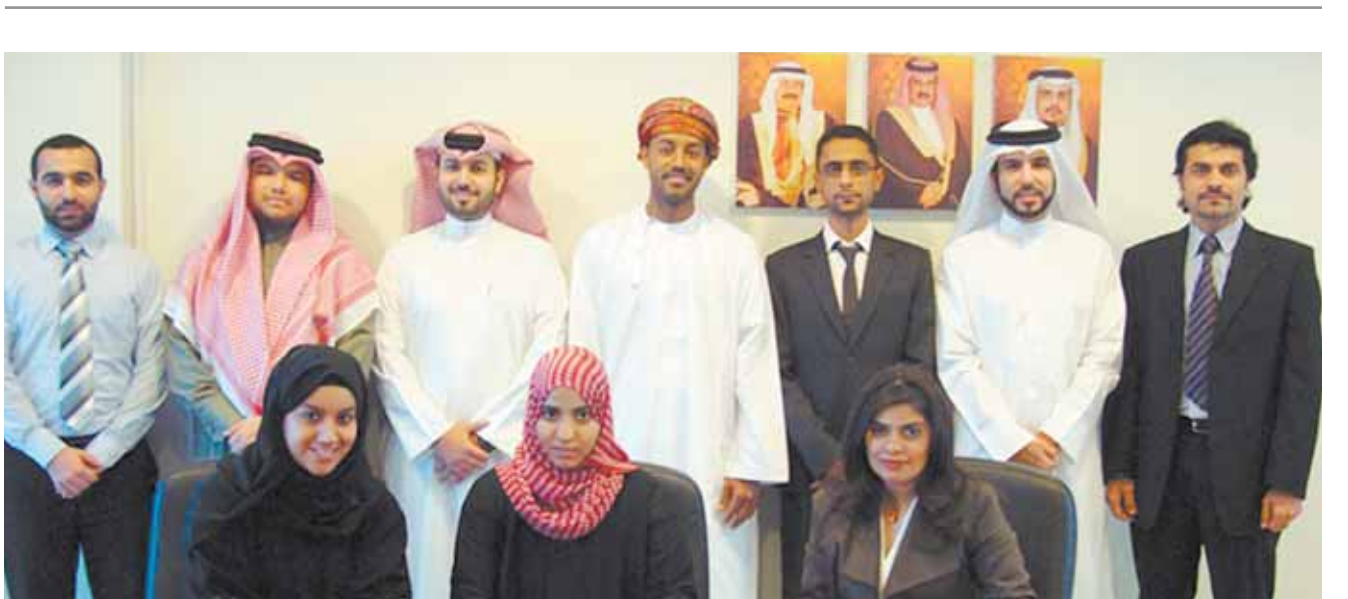
○ زيارة الوفد العماني لمركز المعلومات.