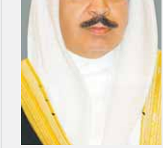
○ وزير الداخلية.

وتحليل سلامة العمل وتقييم المخاطر والتخطيط للحالات الطارئة وفهم ومنع أخطار الانفجارات وتحليل أخطار العمليات الصناعية والصحة الصناعية والصحة المهنية.