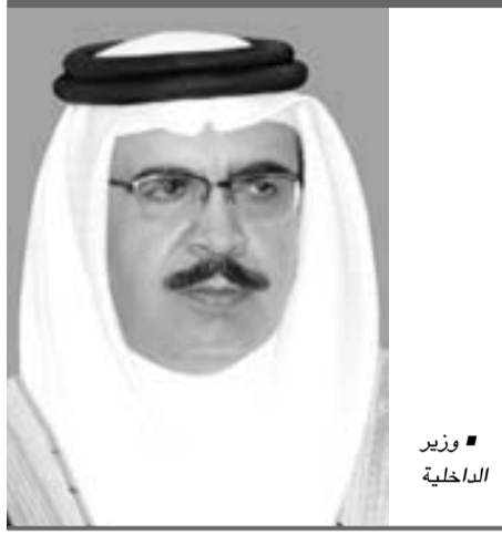
■ وزير الداخلية

وسيتّم عقد كثير من ورش العمل في يومي 20-21 فبراير/شباط، وتشمل معايير السلامة والوقاية من الحرائق وتكوين ثقافة تهدف لأكثر من مجرد تحقيق السلامة وإدارة عملية التغيير وتحليل الأسباب الجذرية ووضع خطة لتنفيذ نظام إدارة حماية البيئة والتحقيق في الحوادث وتقديرات التعرض للأخطار الأمنية والتكامل بين الأمن والسلامة وتقييم الأداء في مجالات الصحة والسلامة وتحقيق ديمومة التغيير في سلوك العاملين تجاه السلامة وتحليل سلامة العمل وتقييم المخاطر والتخطيط لحالات الطارئة، وفهم ومنع أخطار الانفجارات وتحليل أخطار العمليات الصناعية والصحة الصناعية والصحة المهنية.