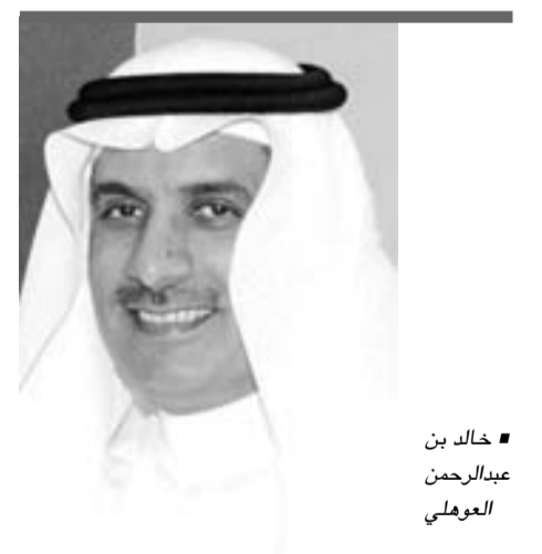
■ خالد بن عبدالرحمن الغويلي

أشاد رئيس جامعة الخليج العربي خالد بن عبدالرحمن الغويلي بجائزة حمدان بن راشد آل مكتوم للأداء التعليمي المتميز، منوهاً إلى أنها "استطاعت بثوة مكانة مرموقة عالمياً في فترة قياسية، كواحدة من أفضل المؤسسات الداعمة لمجال الأبحاث والعلوم".